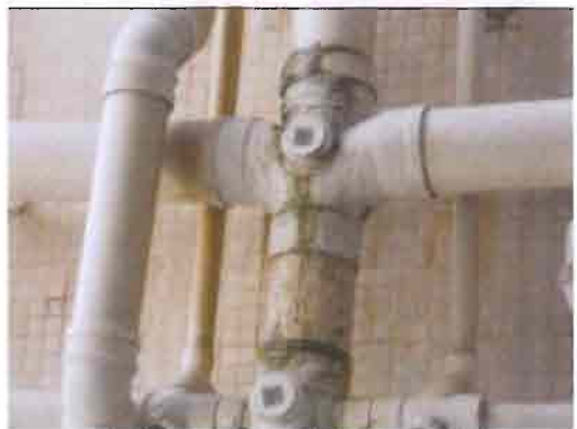
康宏閣 18G 廁所污水坭渠漏水