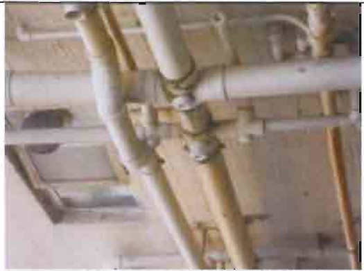
康宏閣 17G 廁所污水坭渠漏水