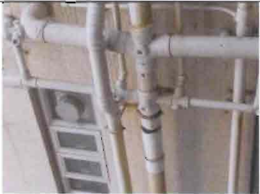
康宏閣 19G 廁所污水坭渠漏水