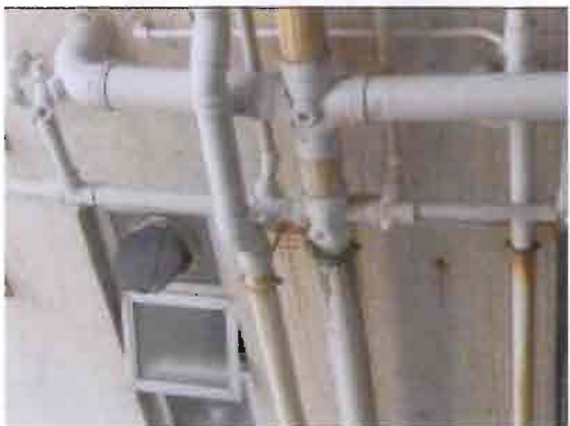
康宏閣 20G 廁所污水坭渠漏水