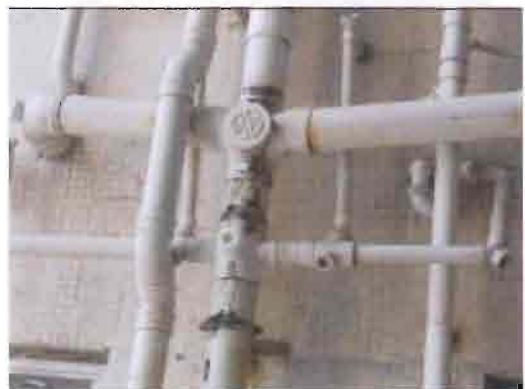
康宏閣 23G 廁所污水坭渠漏水