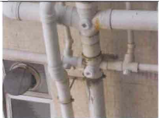
康宏閣 22G 廁所污水坭渠漏水