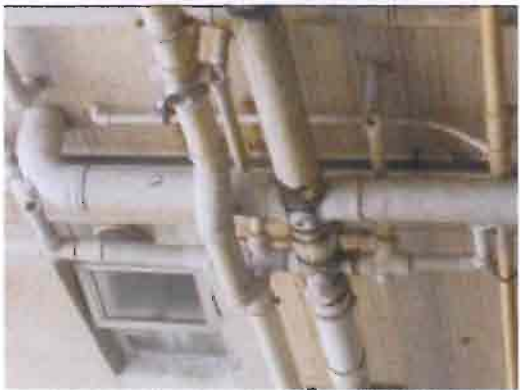
水康宏閣 16G 廁所污水坭渠漏水