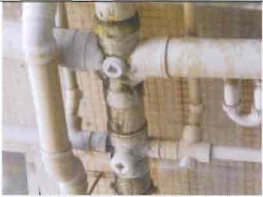
康宏閣 15G 廁所污水坭渠漏